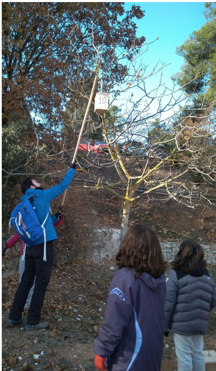
1. Instalación de cajas nido en el Parc Natural de la Font Roja

Imágenes de algunas de las actividades e inversiones llevadas a cabo de las seleccionadas y financiadas por la campaña de presupuestos participativos infancia: