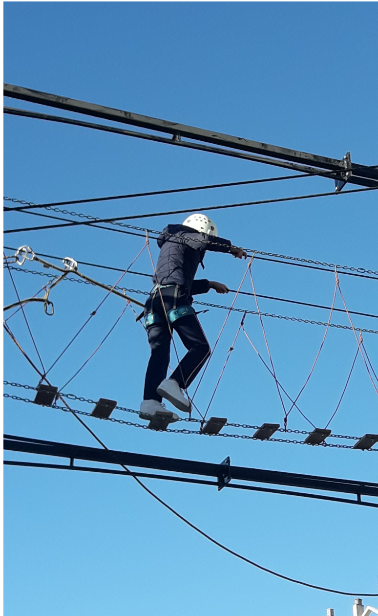
3. Actividades de aventura: puente tibetano