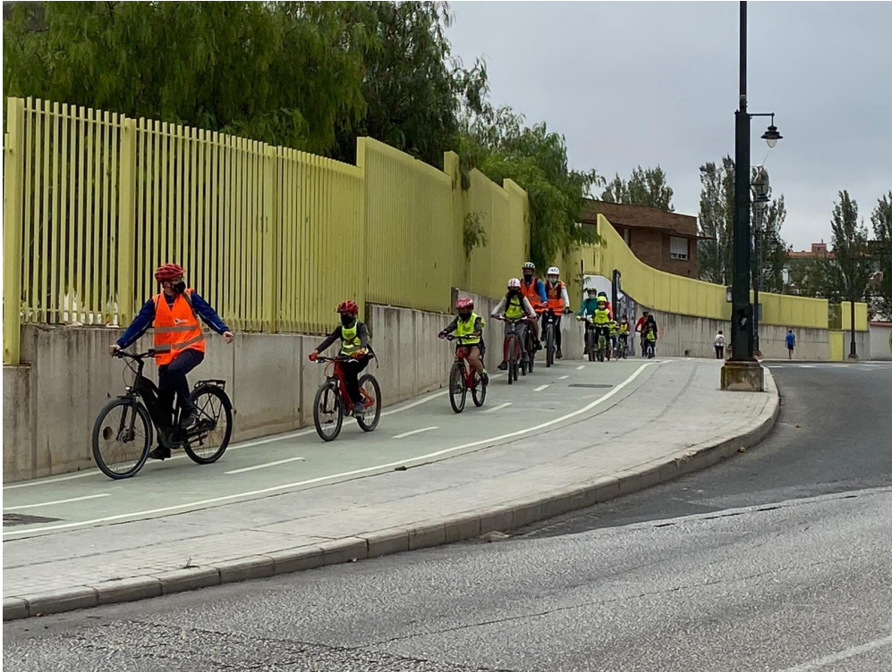
5.Actividad “Coneix el carril bici”. Campaña 2020.